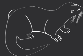
[ Lutra lutra ]