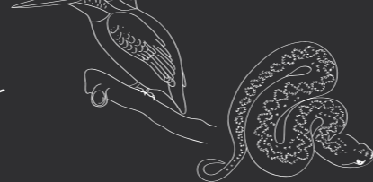
[ Vipera latastei ]